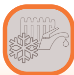
Antigelo Riscaldamento e Sanitario